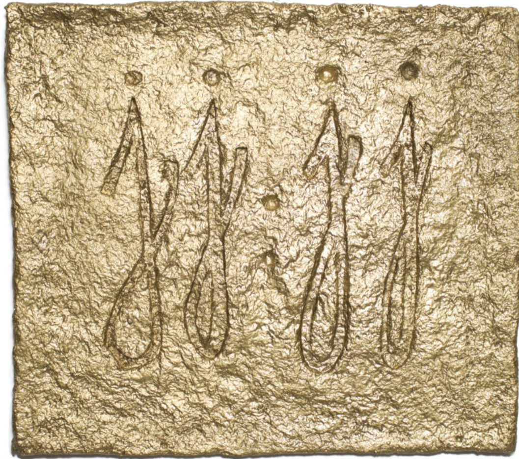
Casio Polvo de oro y aceite de lino sobre papel maché con estructura de zinc 28,5 x 25,5 cm. 2020