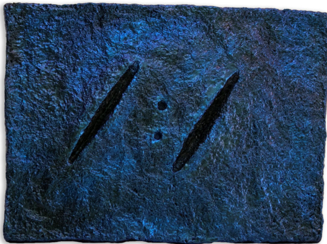
Divisiones Papel maché policromado con pigmentos iridiscentes y estructura de zinc. 31 x 23 cm. 2022