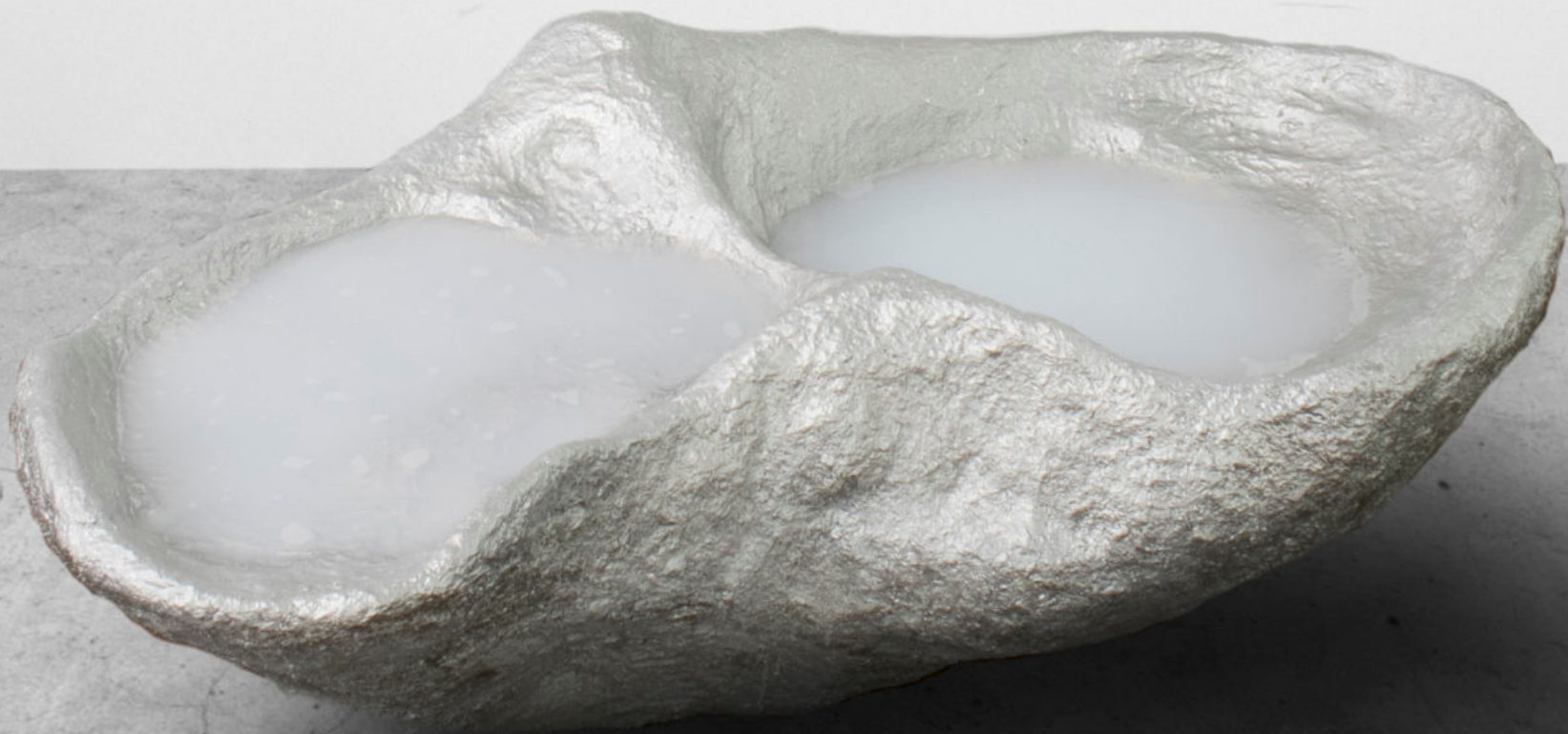
Libación Papel macheé, aluminio, pintura bicapa y agua enjabonada 160 x 60 x 75 cm. 2022