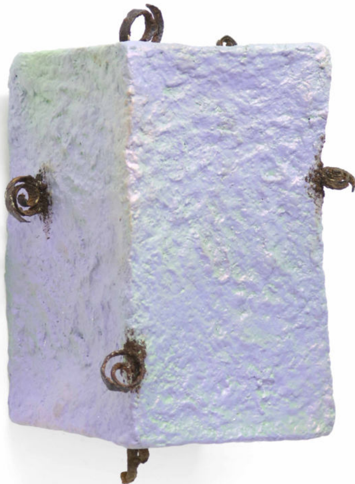
Curame Papel macheé, hierro erosionado y pintura bicapa 40 x 30 x 25 cm. 2022