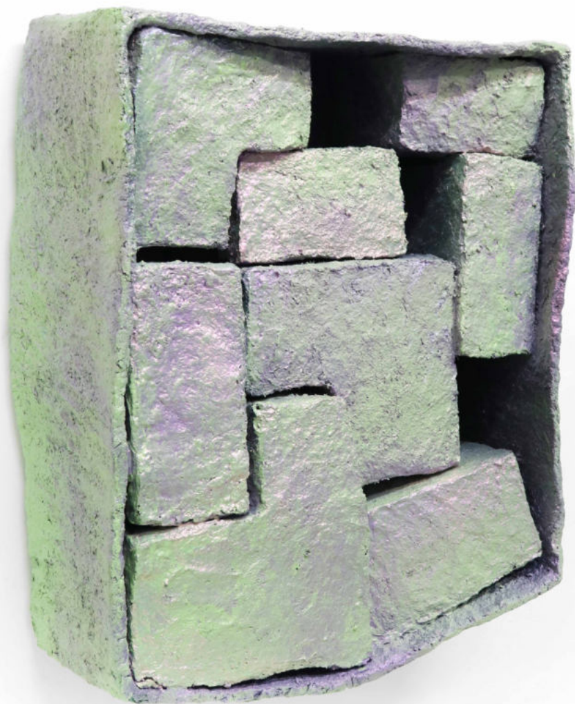
Culpas Papel maché y pintura bicapa 58 x 48 x 25 cm. 2022