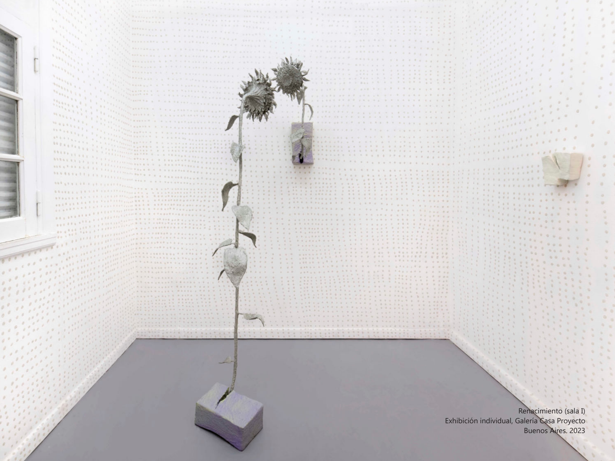
Renacimiento (sala I) Exhibición individual, Galería Casa Proyecto Buenos Aires. 2023