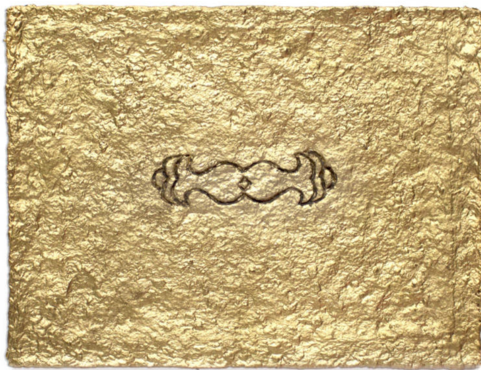
Sin título Polvo de oro, pigmento iridiscente y aceite de lino sobre papel macheé con estructura de zinc. 37 x 29 cm. 2020