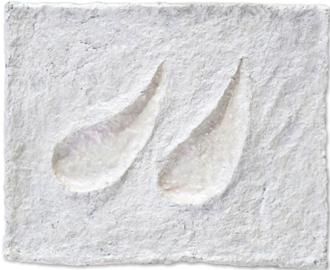
Jotas Papel maché policromado con estructura de zinc 2021