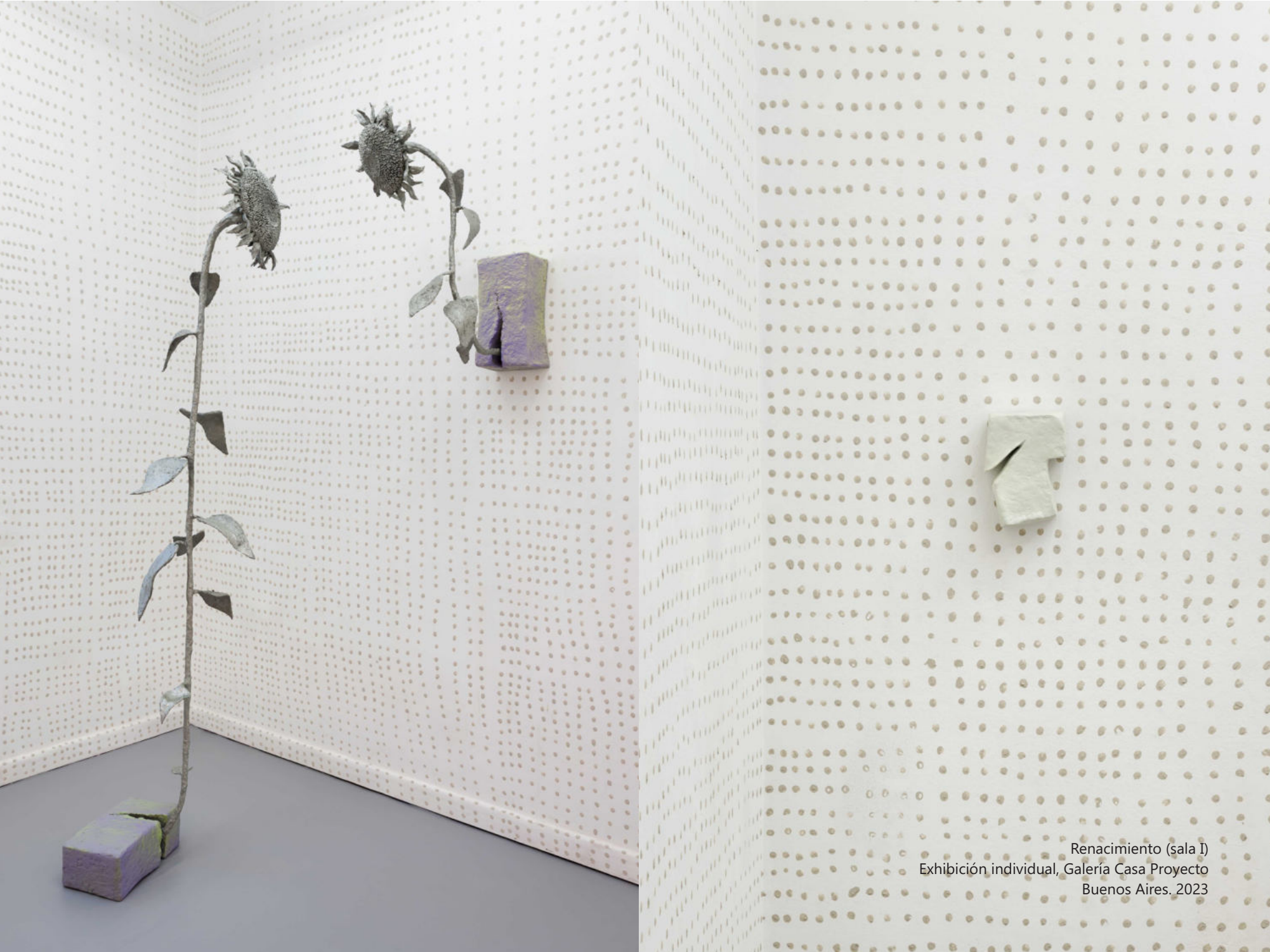
Renacimiento (sala I) Exhibición individual, Galería Casa Proyecto Buenos Aires, 2023