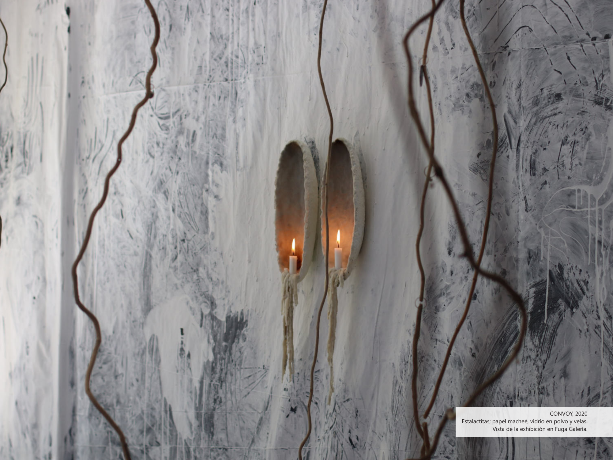
CONVOY, 2020 Estalactitas; papel macheé, vidrio en polvo y velas. Vista de la exhibición en Fuga Galería.