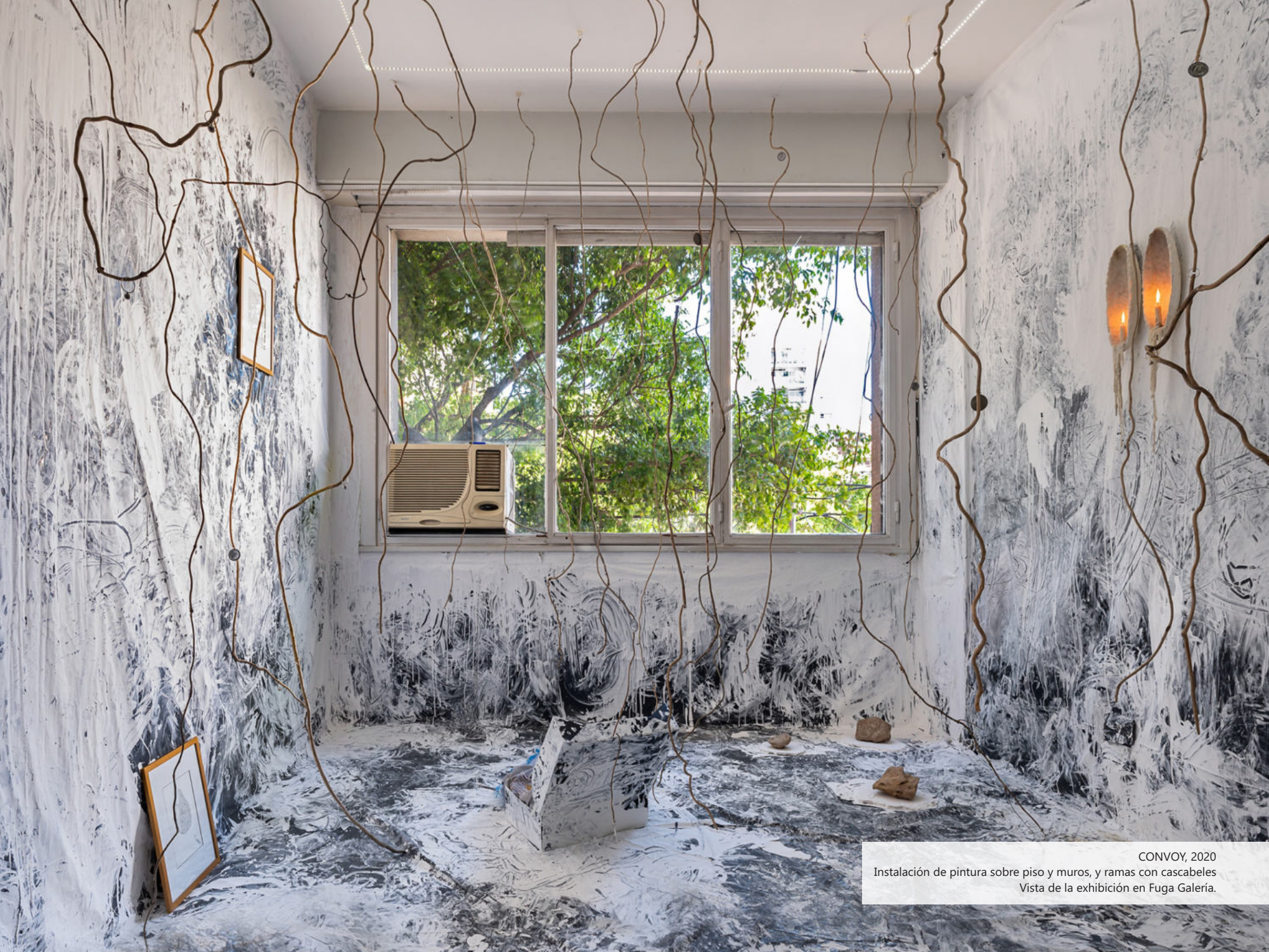
CONVOY, 2020 Instalación de pintura sobre piso y muros, y ramas con cascabeles Vista de la exhibición en Fuga Galería.