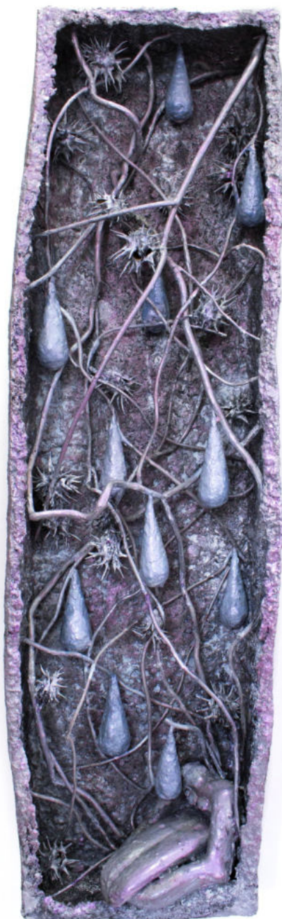
Sin título Papel maché y plantas secas policromadas 97 x 28 x 14 cm. 2021