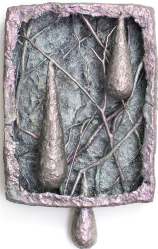
Sin título Papel maché policromado con pigmentos iridiscentes 33 x 20 x 6 cm. 2021