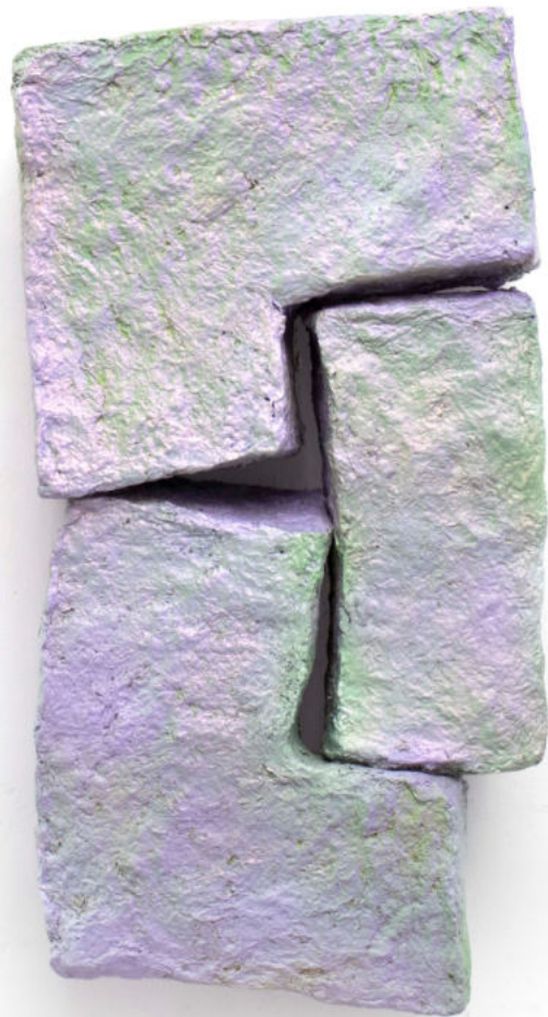
Known pressure Papel machée y pintura bicapa 2022