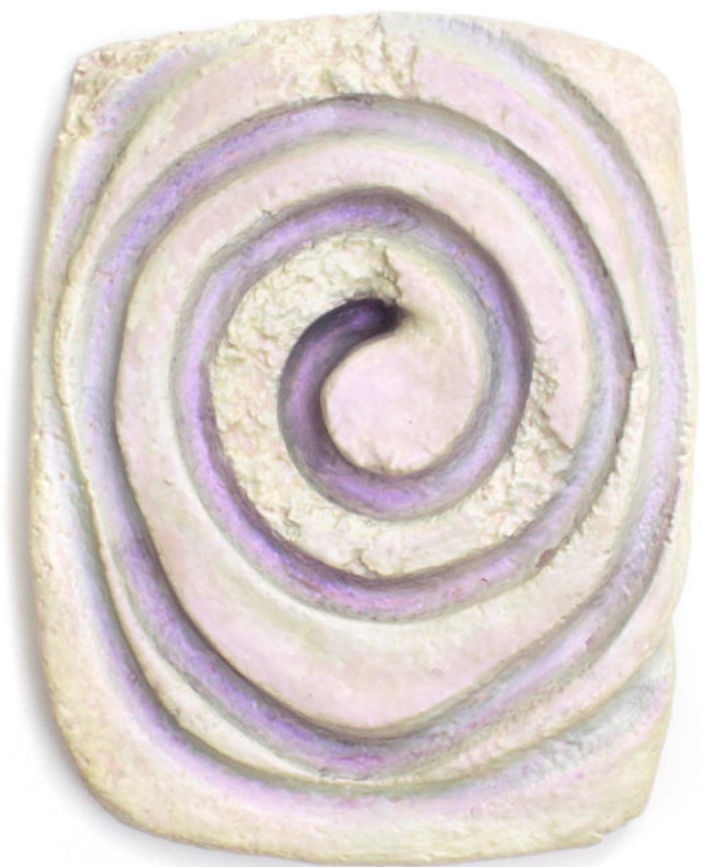
Uuundo Esmalte y pigmento iridiscente sobre papel maché 24,5 x 32 x 4 cm. 2021