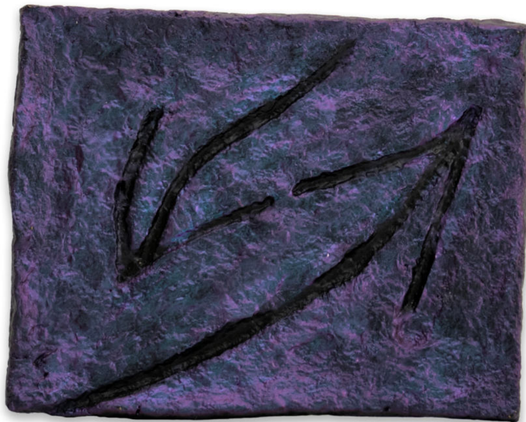
Direcciones Papel maché policromado con pigmentos iridiscentes y estructura de zinc 24,5 x 19,5 cm. 2022