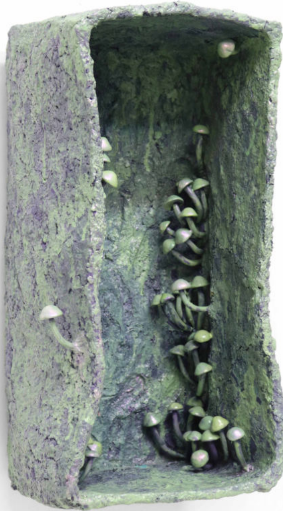
Penicilina Papel macheé, masilla epoxi y pintura bicapa 40 x 23 x 21 cm. 2022