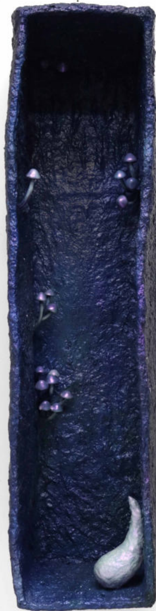
Sin título Papel macheé, masilla epoxi y pintura bicapa 72 x 23 x 16 cm. 2022