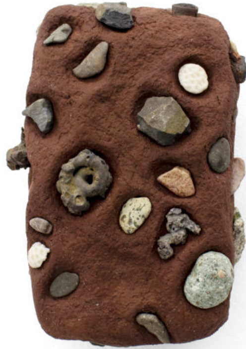
Chicco das pedras Papel macheé, pigmentos naturales, piedras y hierro 18 x 12 x 9 cm. 2023