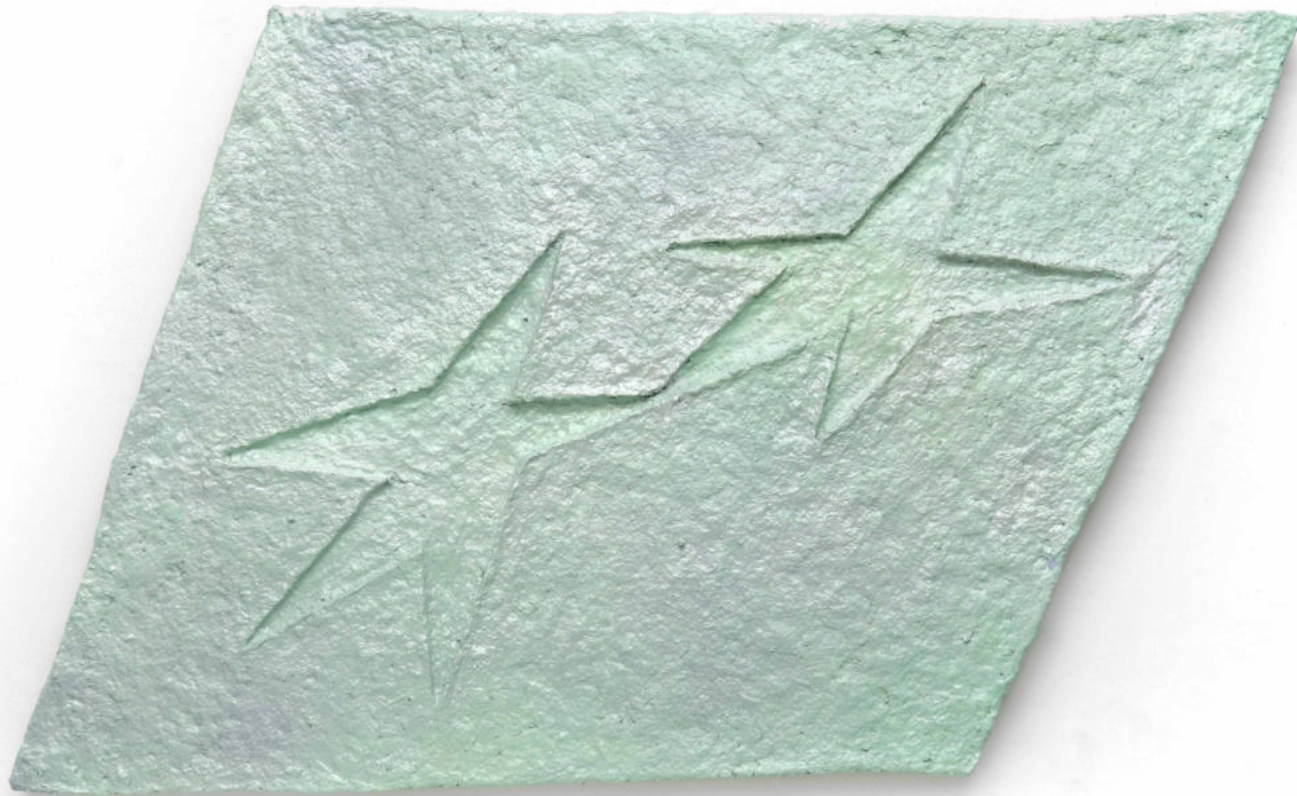
Contacto Pintura tricapa sobre papel macheé 90 x 54 x 3 cm. 2022