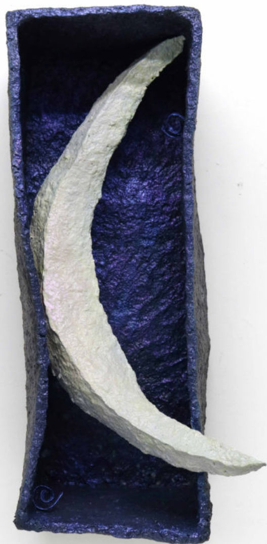
Eras Papel macheé, hierro erosionado y pintura bicapa 57 x 28 x 22 cm. 2022