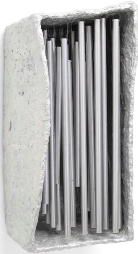
Sin título Papel macheé, aluminio y pintura bicapa. 48 x 25 x 24 cm. 2022