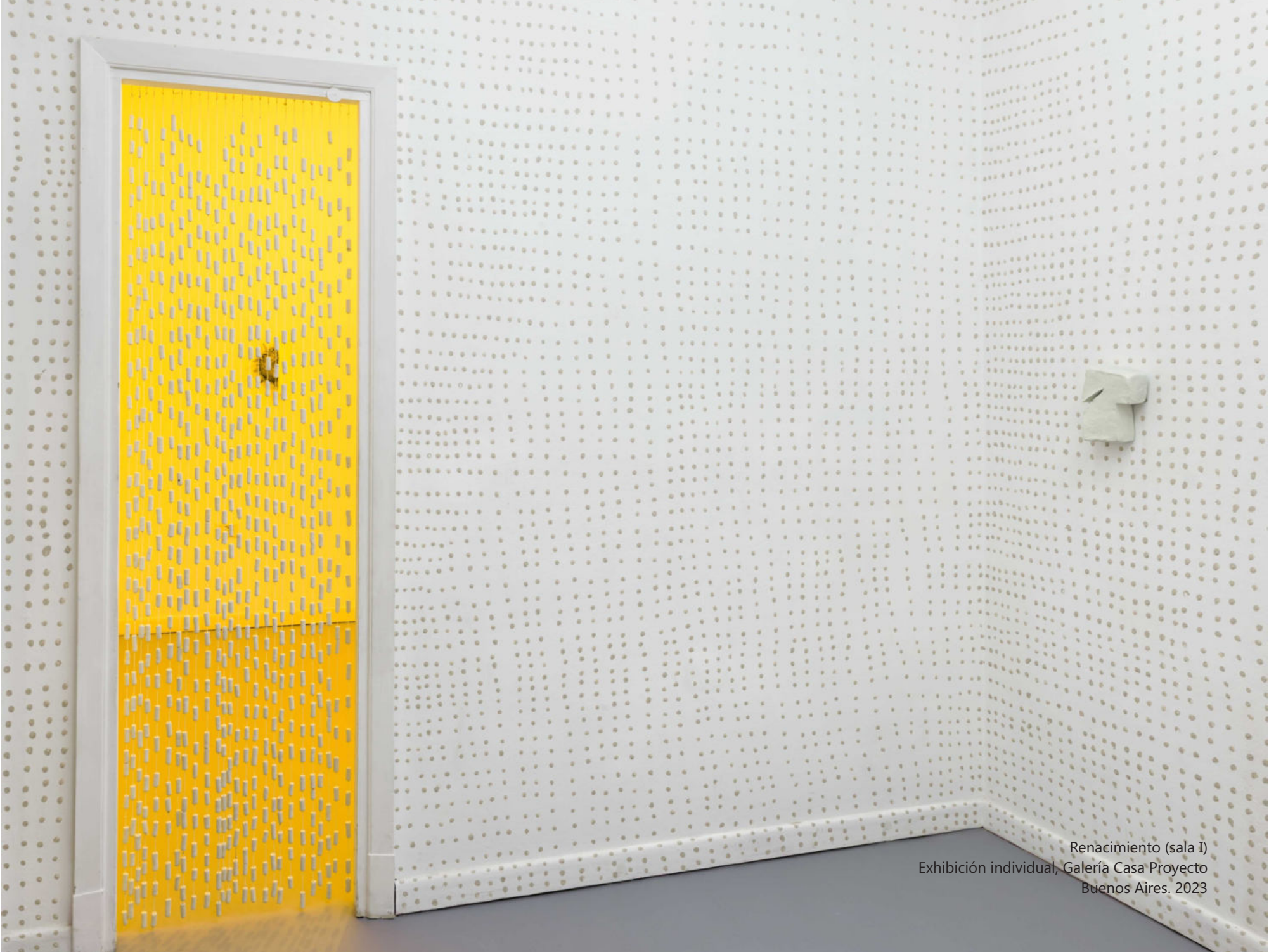
Renacimiento (sala I) Exhibición individual, Galería Casa Proyecto Buenos Aires. 2023