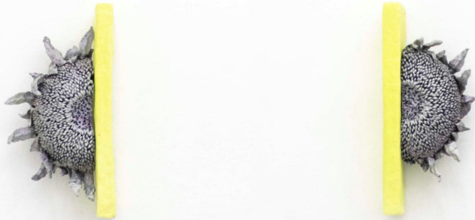
Espesura Papel macheé, semillas, pintura bicapa 34,5x17,5x9 cm cada una. 2023