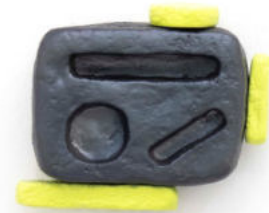
Inconfidencia Papel macheé, masilla epoxi, pintura bicapa 15x18x6 cm cada una. 2023