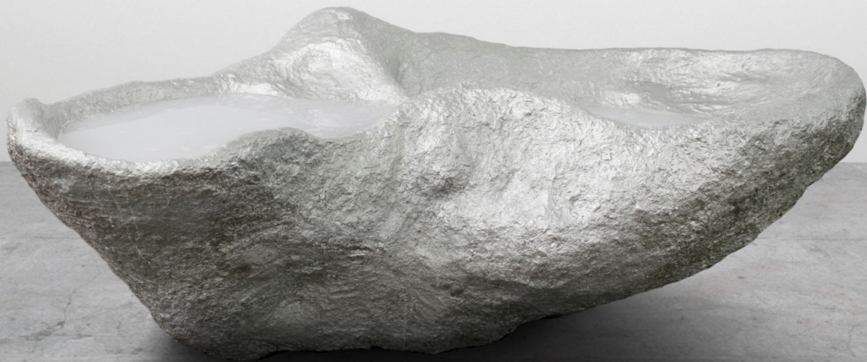
Libación Papel macheé, aluminio, pintura bicapa y agua enjabonada 160 x 60 x 75 cm. 2022