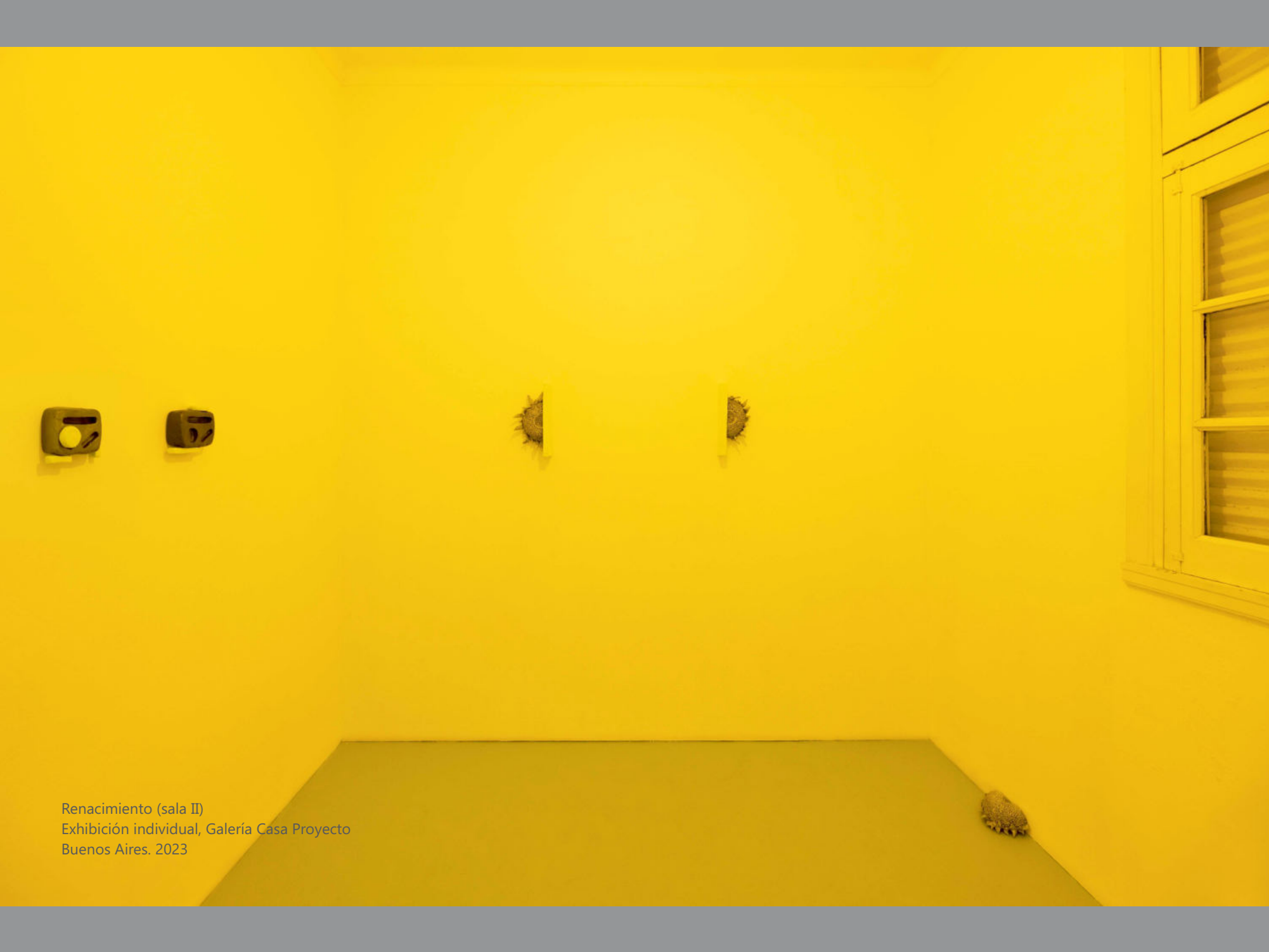
Renacimiento (sala II) Exhibición individual, Galería Casa Proyecto Buenos Aires. 2023