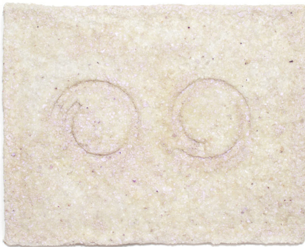
Virtuoso Pigmento iridiscente, aceite de lino y cristales de cuarzo sobre papel macheé con estructura de zinc. 25,5 x 20 cm. 2020