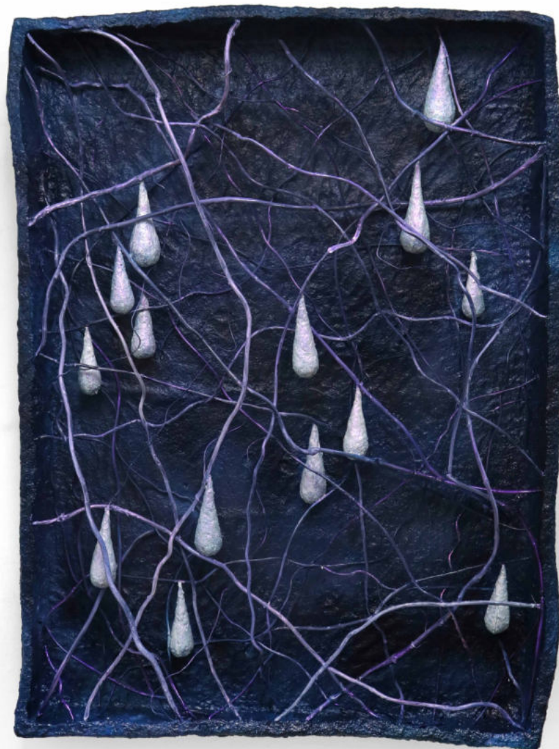
Constelación Papel macheé, ramas y pintura bicapa 130 x 90 x 16 cm. 2021-2022