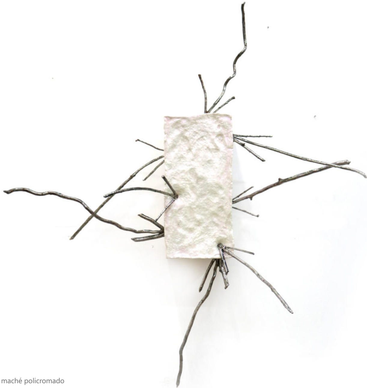
Dispara Ramas cromadas y papel maché policromado 50 x 70 x 50 cm. 2021